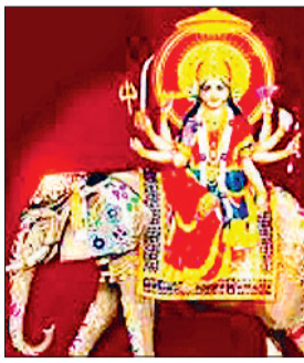
हरिभूमि न्यूज ▶▶ सोनीपत

शारदीय नवरात्र का शुभारंभ भक्तिमय माहौल के बीच हुआ। प्रथम दिन श्रद्धालुओं ने शुभ मुहूर्त पर घरों और मंदिरों में घट स्थापना कर मां दुर्गा के प्रथम स्वरूप शैलपुत्री की पूजा-अर्चना की। पहले दिन मां शैलपुत्री हाथी पर सवार होकर आईं। भक्तों ने व्रत धारण कर माता रानी से परिवार और समाज की सुख-शांति व समृद्धि की प्रार्थना की। सुबह से ही मंदिरों में