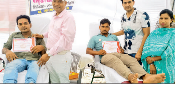
गोहाना। शिविर में रक्तदाताओं को प्रोत्साहित करते अतिथि एवं आयोजक।